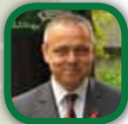
Йордан Николов областен управител (в периода на развитие на програмата)